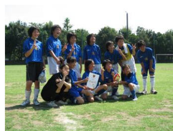
(女子サッカークラス)