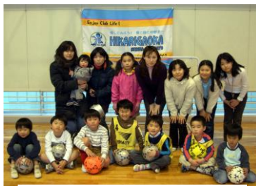
(幼児・小学生&ファミリークラス)