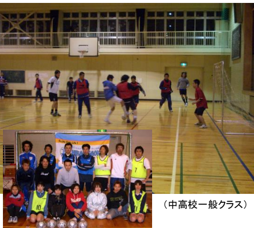
(中高校一般クラス)