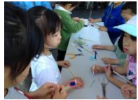
クラブ会員(冒険クラブ)