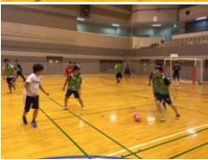
(中高校一般クラス)